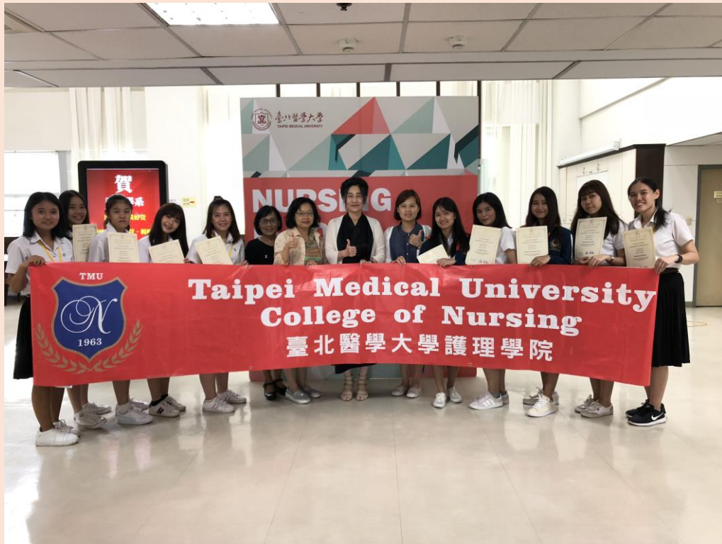
圖四、北醫護理國際交流課程