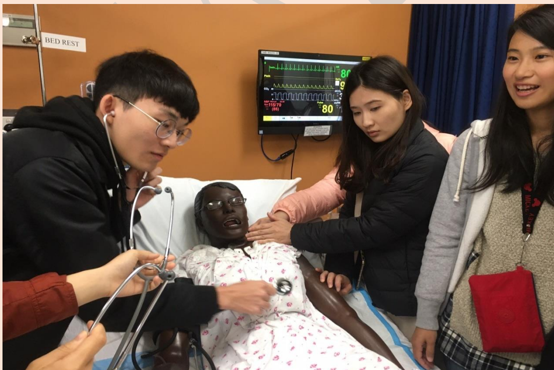
圖二、南昆士蘭大學護理學系模擬病人，有不同年紀、人種、情境，可以聽到呼吸音和腸蠕動。