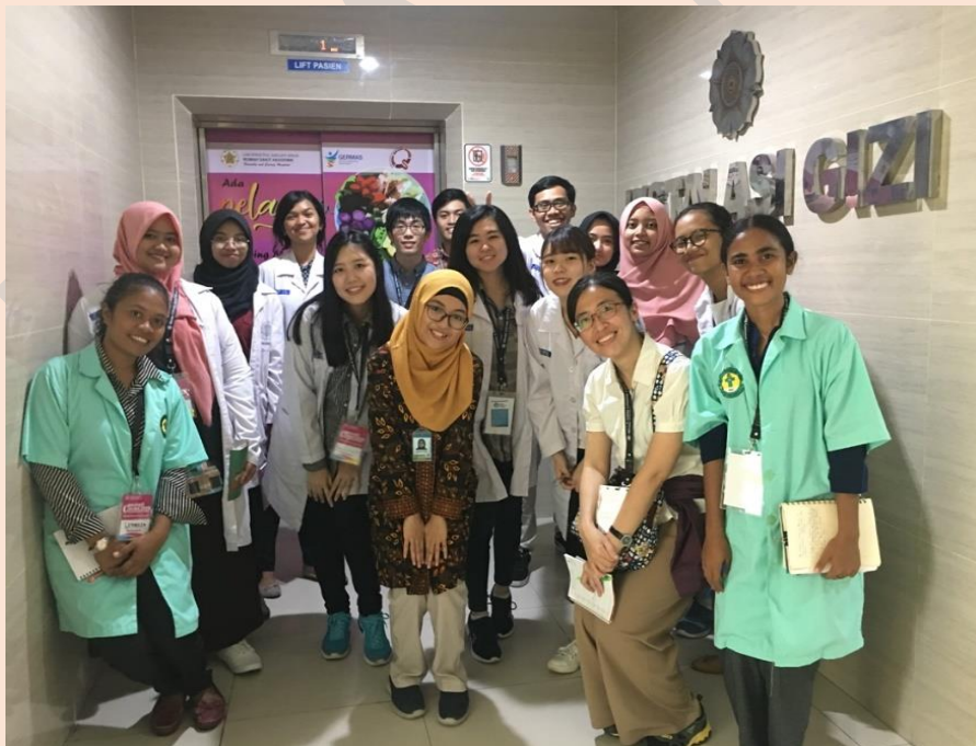
圖一、2019 印尼日惹大學的國際交流

北醫護理國際活動順利推展，衷心感謝全院教師、學生與行政同仁協力及熱忱投入，與國際友人相挺才有如此豐盛國際交流成果。