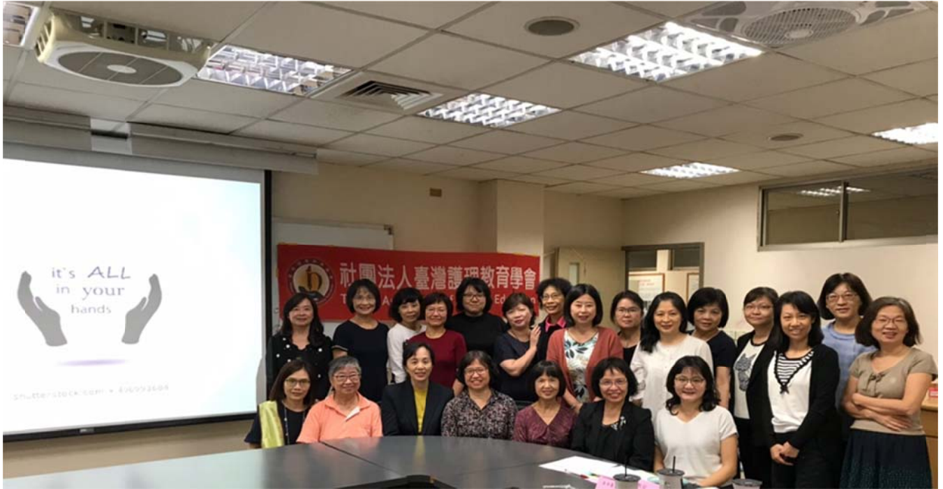
2019/10/19 『「護理碩博士教育政策共識」 高峰論壇』大合照