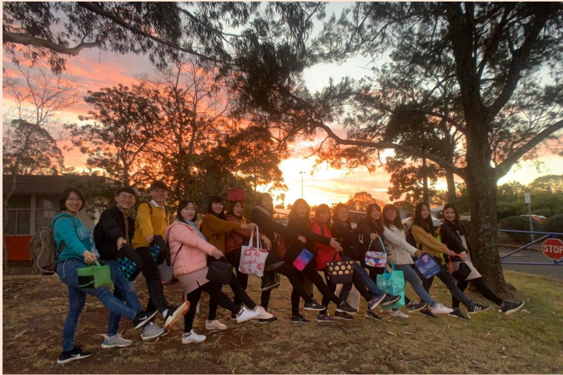
圖三、每天放學等待寄宿家庭接送，伴隨著一抹斜陽