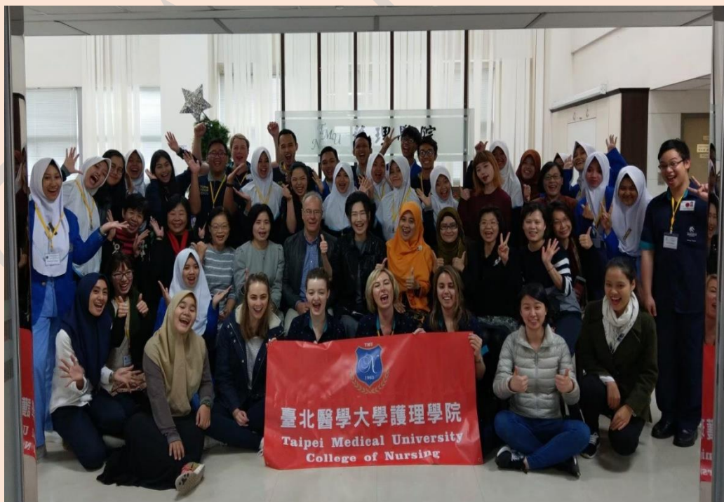
圖三、北醫護理國際交流課程