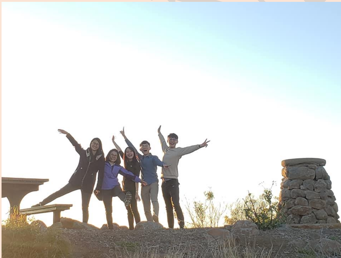
圖四、與寄宿家庭出遊，探索大自然的奧妙