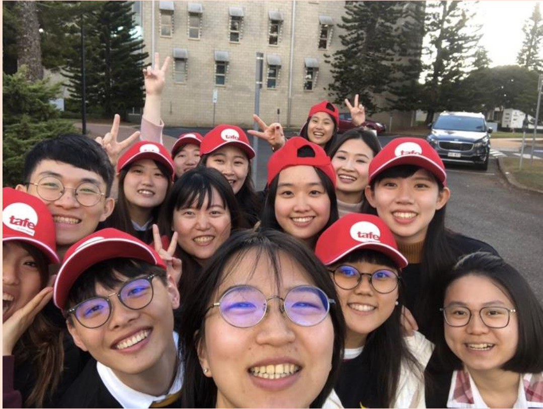
(圖三) 大學部、碩士班、博士班同學一起帶著參訪機構 TAFE 的帽子合影