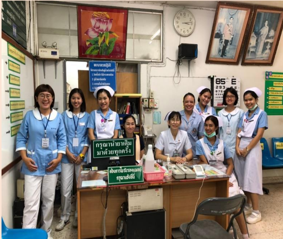
圖二、2019 泰國清邁大學的國際交流