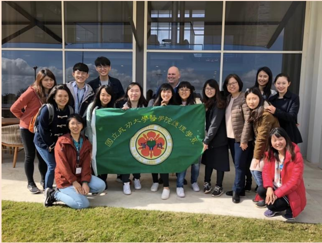
(圖五) 參訪當地新成立的老人安養機構 Infin8care