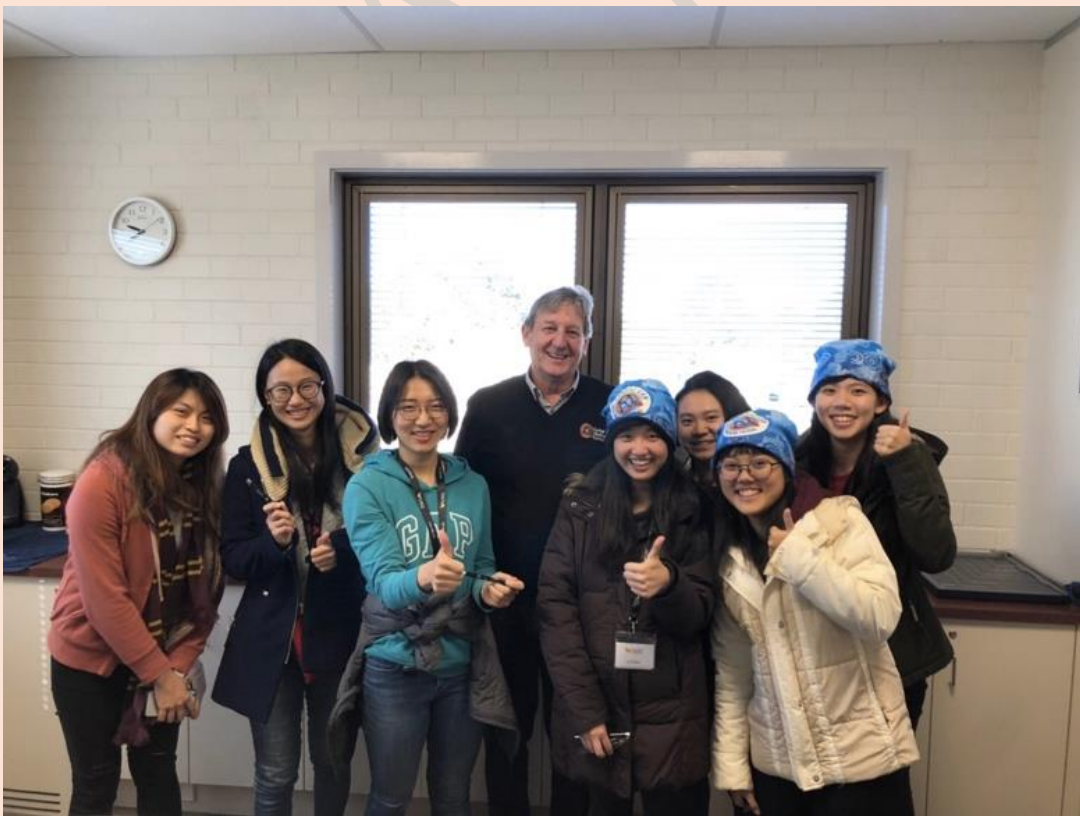
(圖二) Carbal Medical Service 參訪原住民醫療服務機構