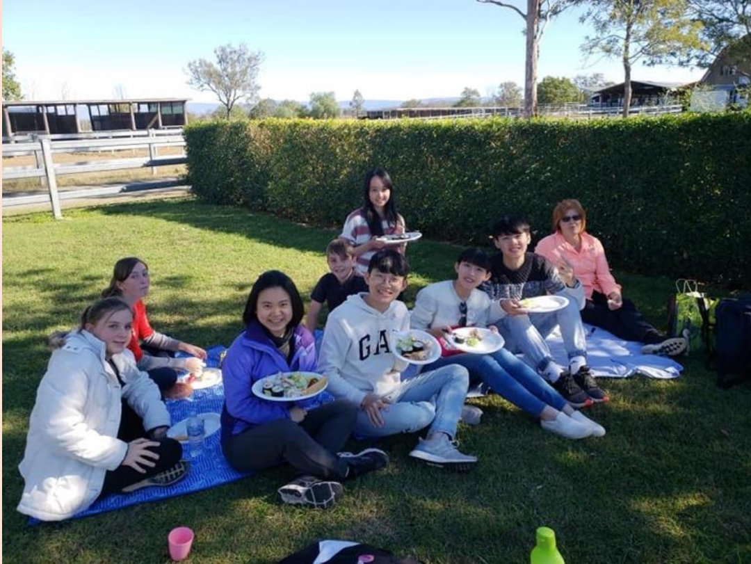
(圖一) 假日和同學的寄宿家庭一同到駱駝農場遊玩、野餐