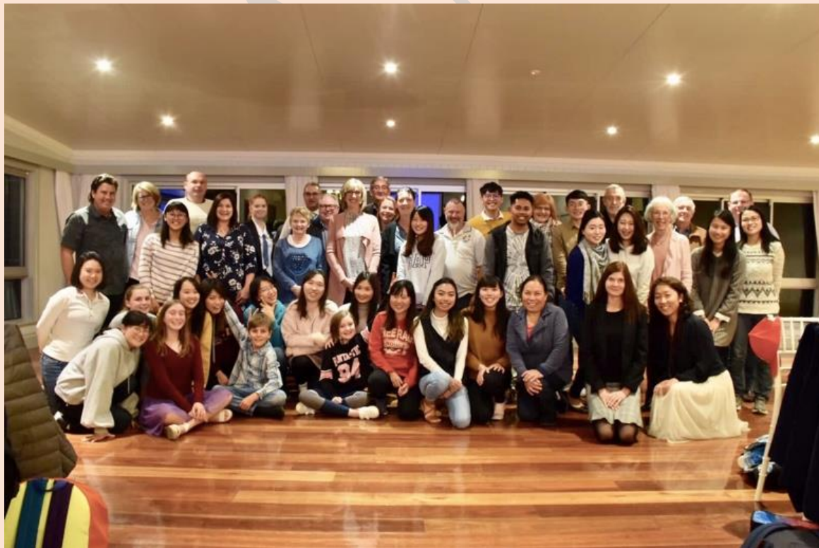
(圖四) 所有同學和所有寄宿家庭、老師合影