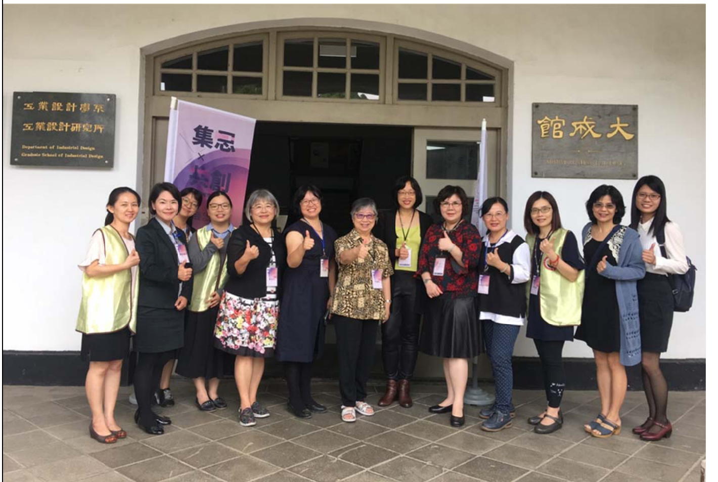
2019/11/23-24 【集思 X 共創】2019 跨域感質研討會--大合照